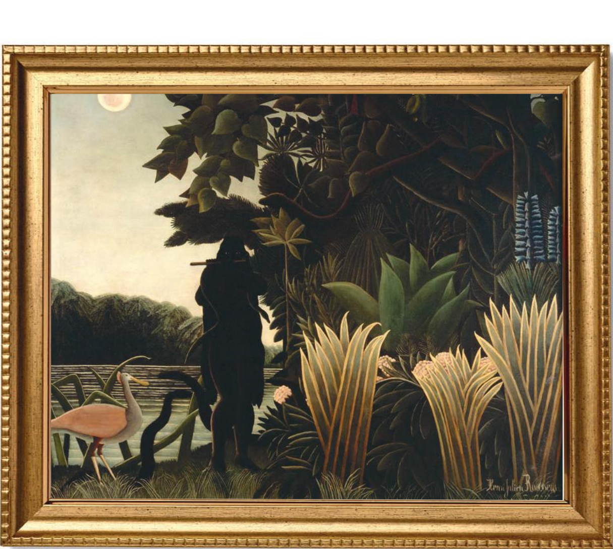
Henri Rousseau, Zmlínáchoh nadá, 1907, olej, plátno, Paříž, Musée d'Orsay

Tento kalendář přináší jen malý výběr těch nejzajímavějších akcí, které se v Praze konají od prosince 2016 do začátku března 2017; desítky dalších jsou uvedeny na našem průběžně aktualizovaném webu www.prague.eu . Zde naleznete i podrobnější údaje o programech, vstupenkách apod.